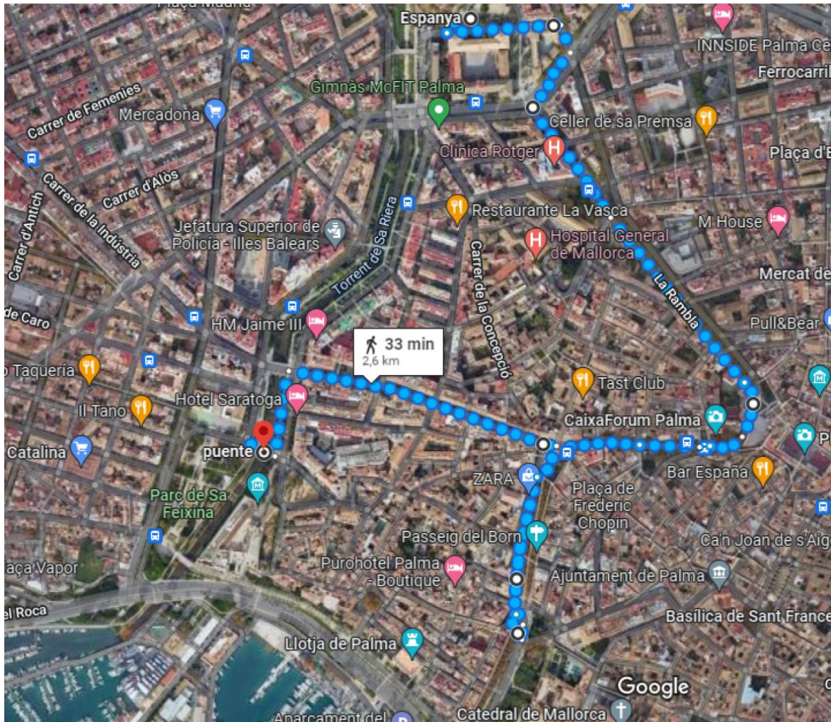
Imatges ©2022 CNES / Airbus, Maxar Technologies, Dades del mapa ©2022 Inst. Geogr. Nacional 200 m