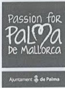
Signat: Catalina Pons Cladera