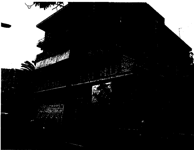
Imagen actual del edificio desde la Avda. Joan Miró

Se espera que se licite en verano de 2018 y las obras se desarrollen desde el último trimestre de 2018 hasta mediados de 2019.