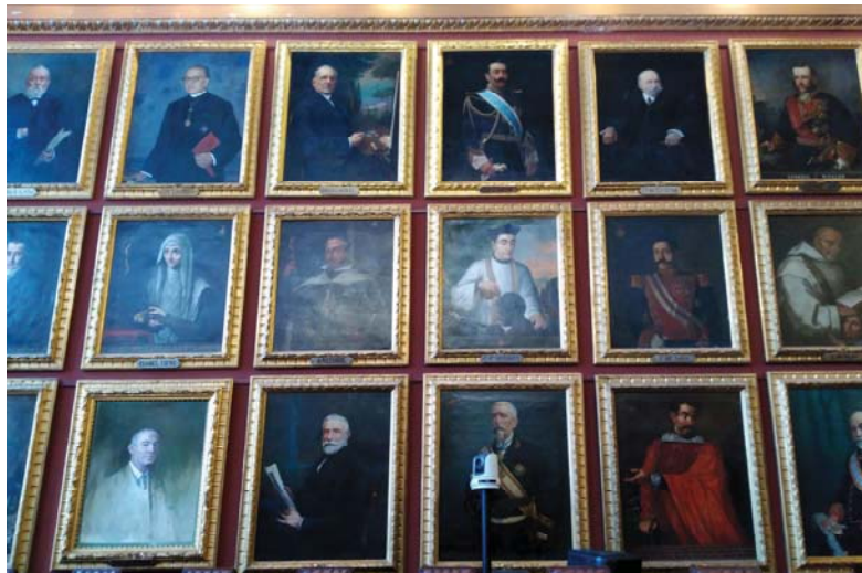
Detall d'una paret de la Sala de Plens de l'Ajuntament de Palma decorada amb la col·lecció de pintures de fills il·lustres. Tots els retrats porten un disseny de vasa idèntic.