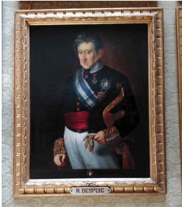
Quadre d'un fill il·lustre amb el marc de talla a imitar.