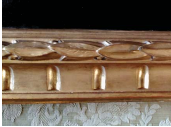
Detall de la motllura a imitar. La caracteritzen la cadena de llores a la part convexa, i les incisions a la part còncava.